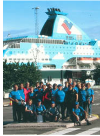
Prav zato, ker je bil Hotel Portus blizu пристаниšča, smo se trajektom zapeljali v Helsinki.