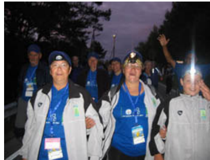
Nočni pohod po otvoritveni slovesnosti