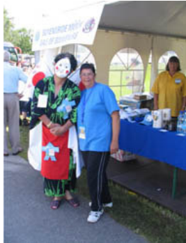
Katjuša slikana s promotorjem naslednjih olimpijskih iger, ki bodo leta 2009 na Japonskem