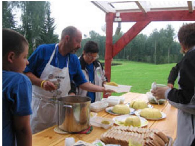
Rezultat: polenta, brodet in "spodregovca" (regrat).!