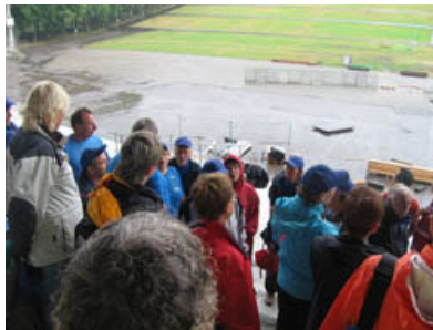
Na tej tribuni smo Američanom zapeli našo himno.