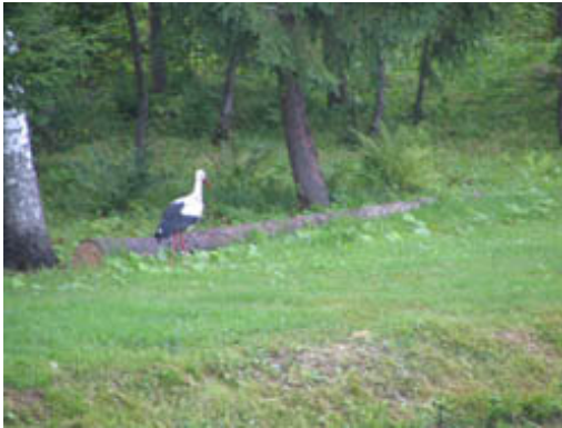
Naše sosede so bile štoklje

Bivališče Vaike Trommi je kot v pravljici. Po štirih dneh bi najraje podaljšali.