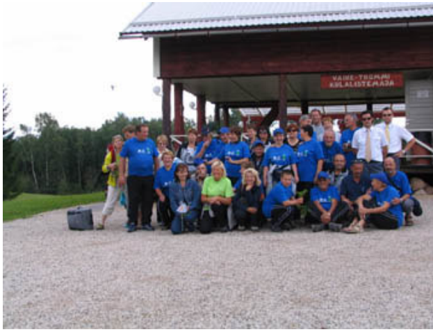
Gasilska slika pred domovanjem v Vaike Trommi z zelo prijaznimi gostitelji.