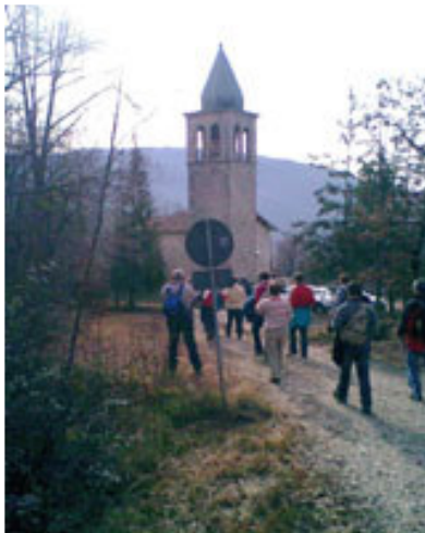
Cerkvica v Oborči