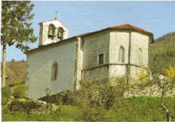
Cervica sv. Kancijana v Britofu