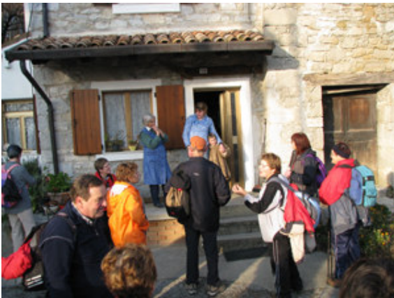
Muc (Prepotto)- stari gospe smo zapeli slovensko pesem

Zaželjeno je, da se naučimo cele pesmice, saj sicer zapojemo le prvo kitico.