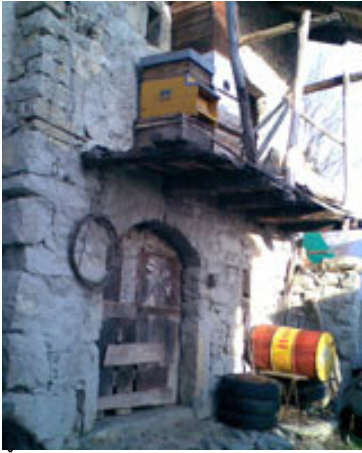
Žalostna podoba ob poti.