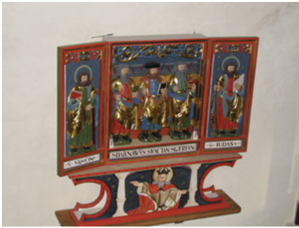
B- z v praznični podobi