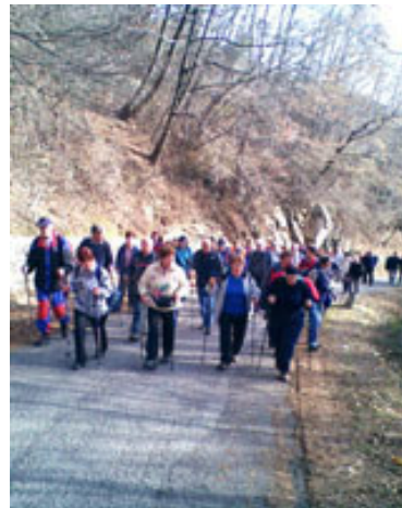
Na ta pohod se je odzvalo kar lepo število pohodnikov željnih novih poti.