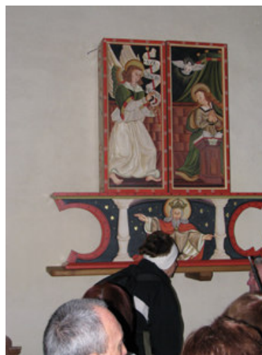
Gotski trikrilni oltar.A- z delovniško podobo