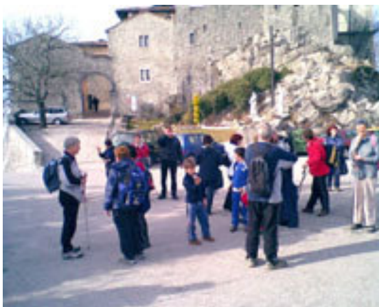
Prispeli smo do cerkve na Stari gori