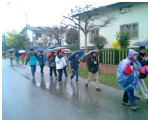
Le korajžno pot pod noge.