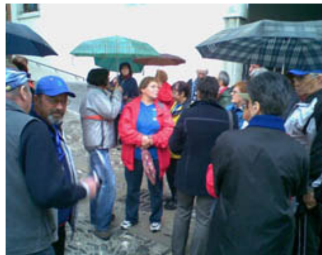
"Uradna prevajalka"! Vodička namreč razlaga v italijanskem jeziku.