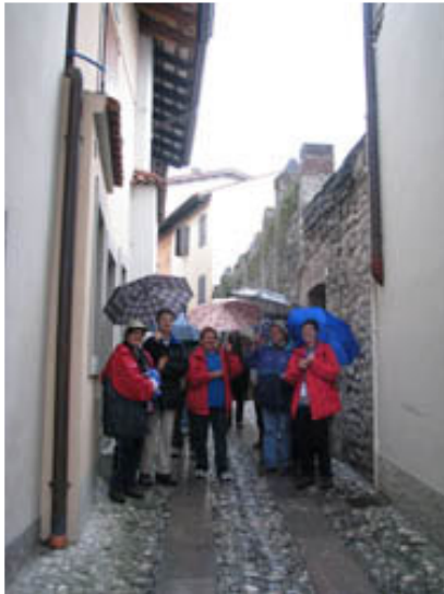
Viden je zid, s katerim je bilo obdano mesto. Ko se je le to širilo, so za eno steno zgradbe uporabili kar zid. Trden je bil dovolj!