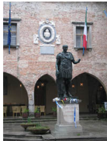
Kip Julija Cezarja, ki pa ni original. Musolini ga je podaril bogati družini Monin kot simbol italijanske moči. Družina je kip pustila mestu za zahvalo, da so jo sprejeli na begu iz Firenc.