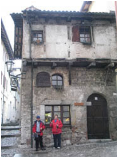
Najstarejša srednjeveška hiša v Čedadu. Spodnje okno je zaradi potrebe zlatarne povečano, ostalo je original. Pogledj dobro: zaradi plačila davka od kvadrature tlorisa, je prvo nadstropje razširjeno.