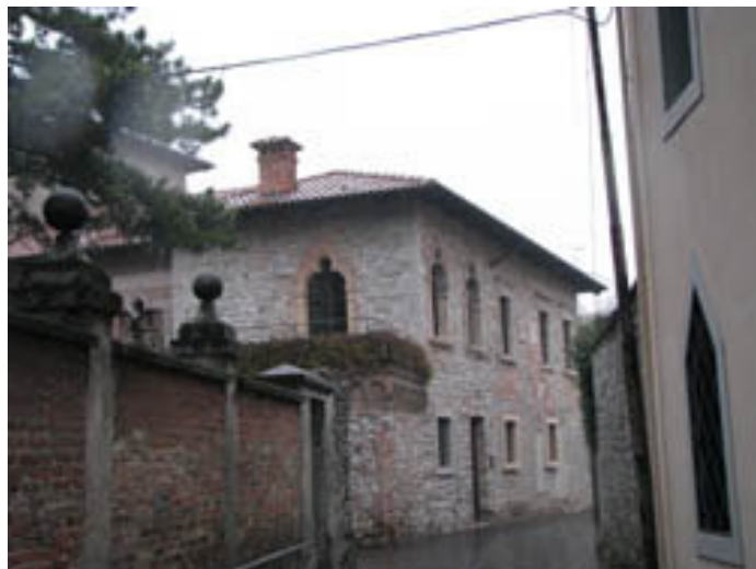
Nekaj tipičnih arhitekturnih spomenikov.