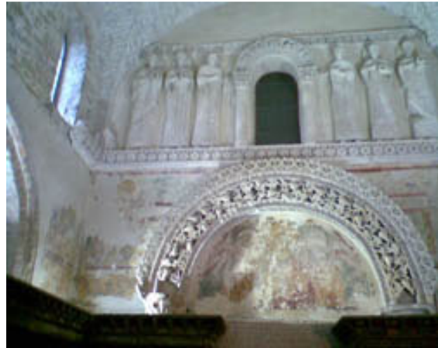
Ohranjeni reliefi so štukature.