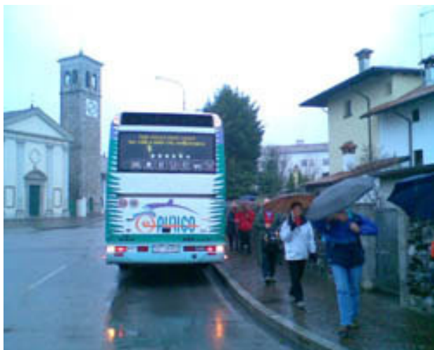
Prispeli smo. danes ne bo šlo brez dežnikov!

Zgodba o Hudičevem mostu . Nadiža je široka in globoka voda. Težko je bilo tu postaviti most. Ko je voda narasla, je most odnesla s sabo. Domačini niso vedeli kako, zato so zaprosili Boga, naj jim pomaga. Le ta jih je uslišal, a za plačilo je zahteval dušo prvega živega bitja, ki bo prehodilo most. Pri gradnji mostu je hudiču pomagala mati. V predpasniku je prinesla veliko skalo in jo vrgla v reko. Le- ta je postala sredina mostu. Na njej sloni glavni steber dveh obokov. Ko je prišel čas plačila domačini niso vedeli kaj bi, koga naj bi žrtvovali. A hudiča so le prelisičili. Čez most so poslali psa, saj je tudi živo bitje. In hudič je moral biti zadovoljen z njegovo dušo. Sedanji izgled je most dobil po obnovi. V prvi svetovni vojni so ga porušili Italijani, da bi zaustavili prodor Avstrijske vojske po uničenju pri Kobaridu. Obnovili so ga Avstrijci.