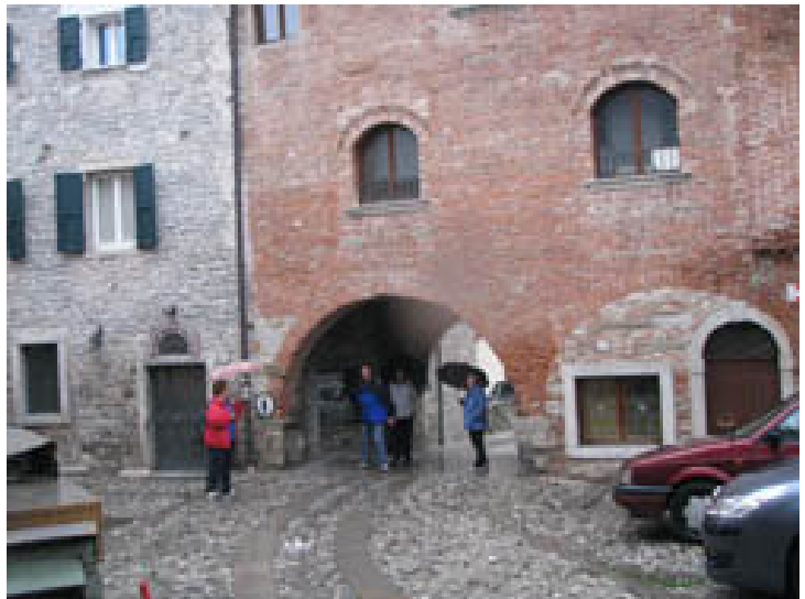
Franko kaže: "Prav tu je bila okrepčevalnica med pohodom, tu!"