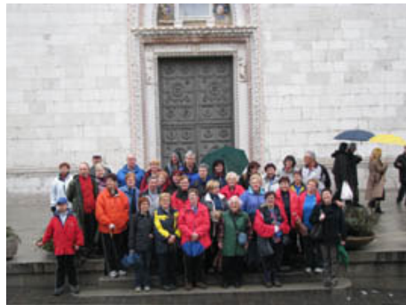
Pred stolnico smo napravili skupinsko sliko z vodičko iz Vidma (prva z desne).