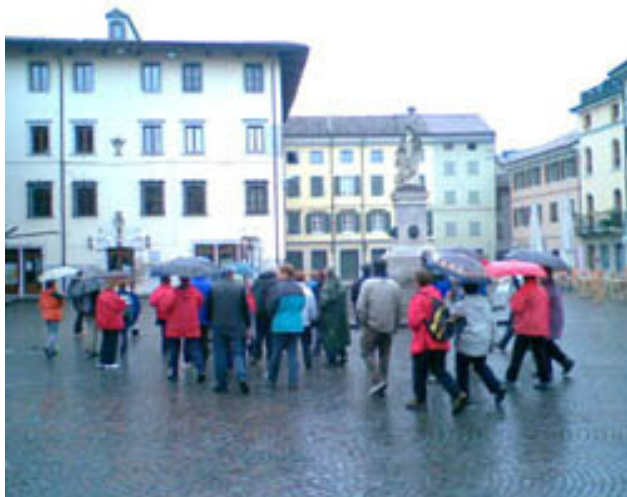
Glavni trg nosi ime po proučevalcu Langobardske zgodovine Paolu Diaconu. Na sliki je kip boginje lova Diane.