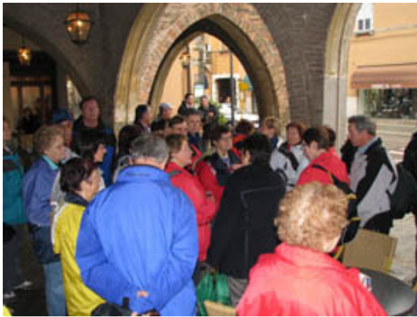
Loža v Mestni hiši.