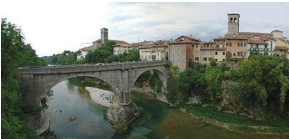
Hudičev most (Ponte del Diavolo).