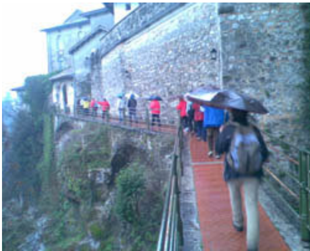
Vhod v Langobardsko svetišče ob Nadiži.