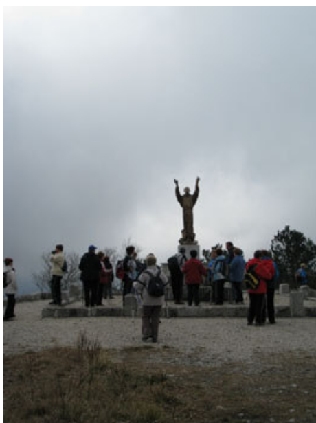
Slika spomenika Sv. Frančiška