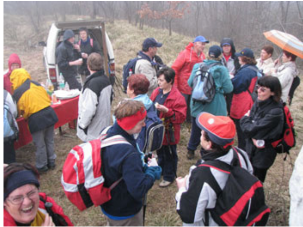
Teknilo je kljub pršenju dežja.